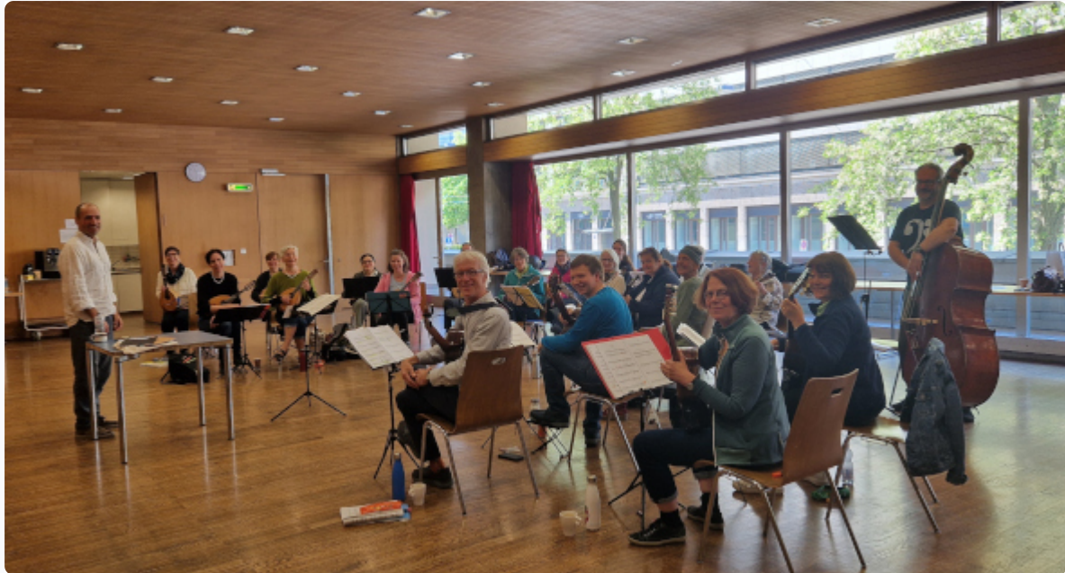
Probeweekend zupf.helvetica 10.-11. Mai 2025

Der gesamte Bericht von Thomas Manetsch mit vielen interessanten Details wurde auf der ZVS-Website ( https://zupfmusik-verband.ch/zupforchester-oetzingen-besucht-luzern/ ) veröffentlicht. Bitte unbedingt lesen!