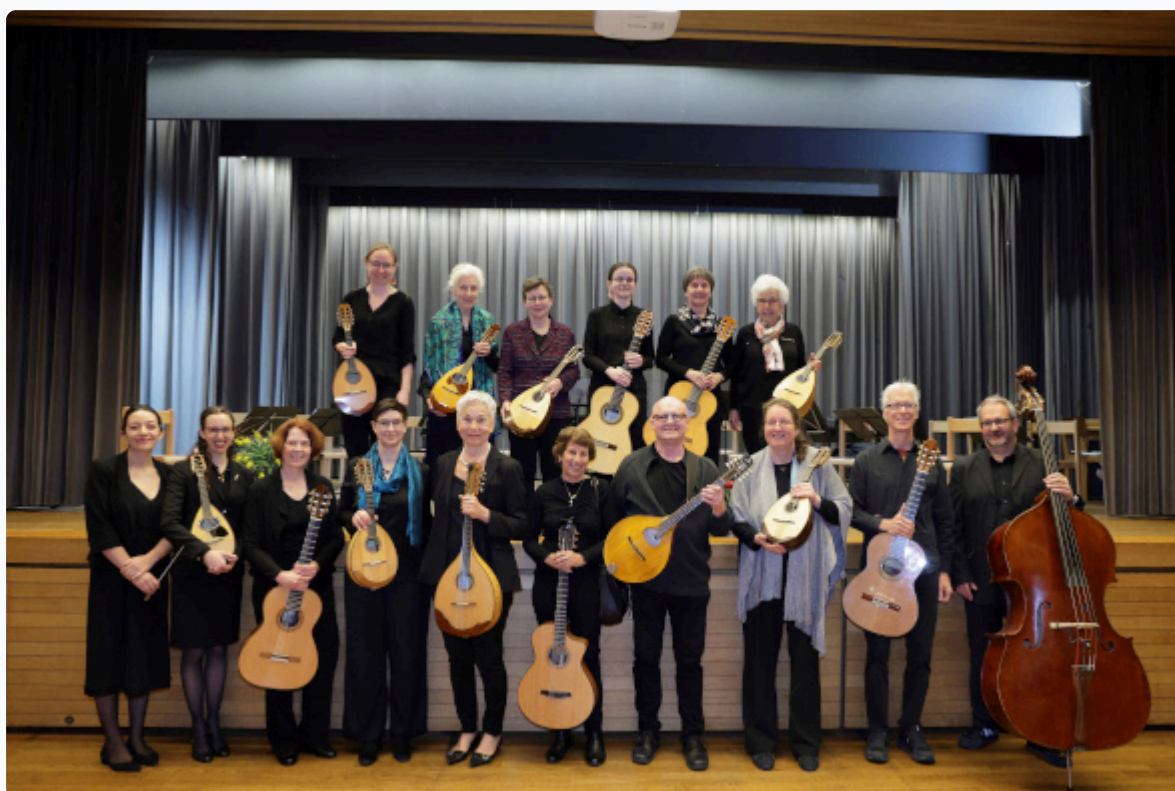
Mandolinen-Orchester Zürich