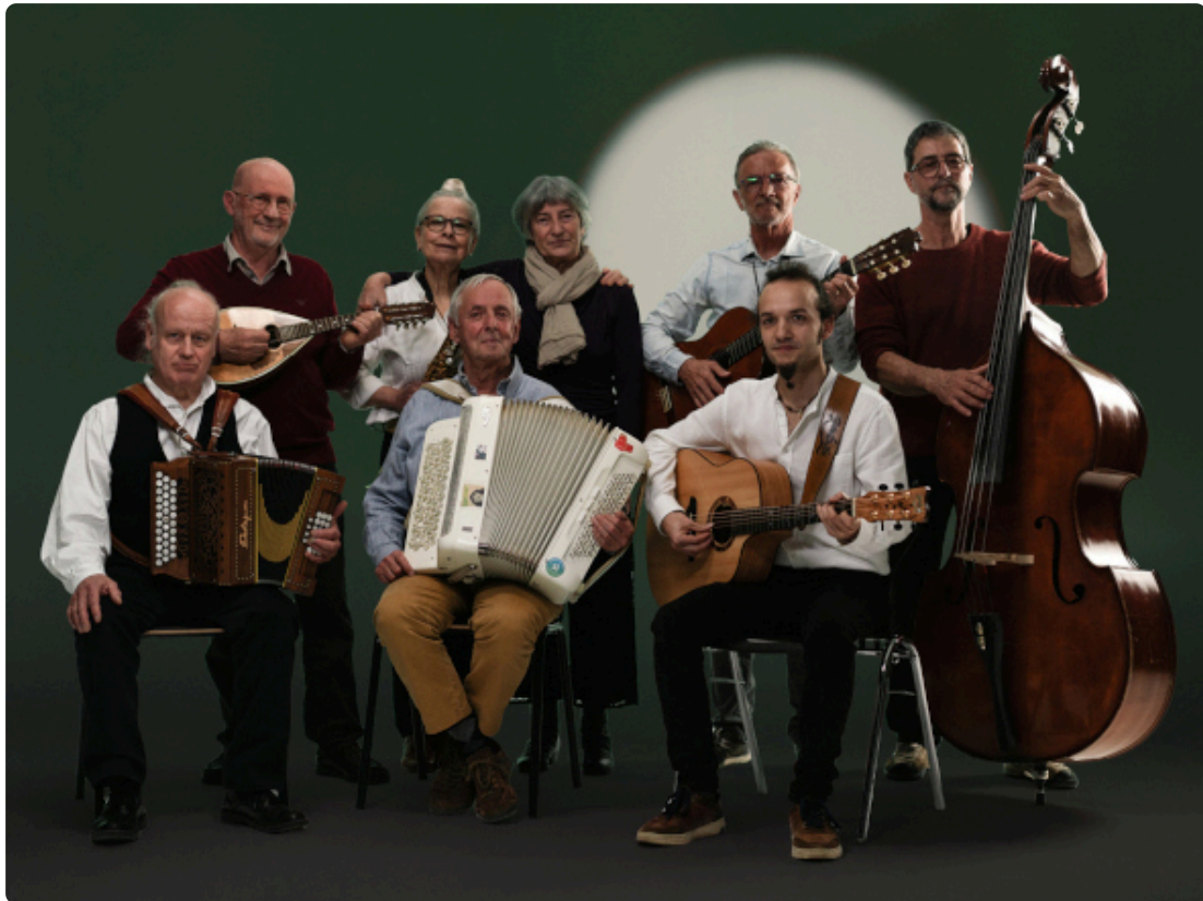
Vox Blenii Vent Negru