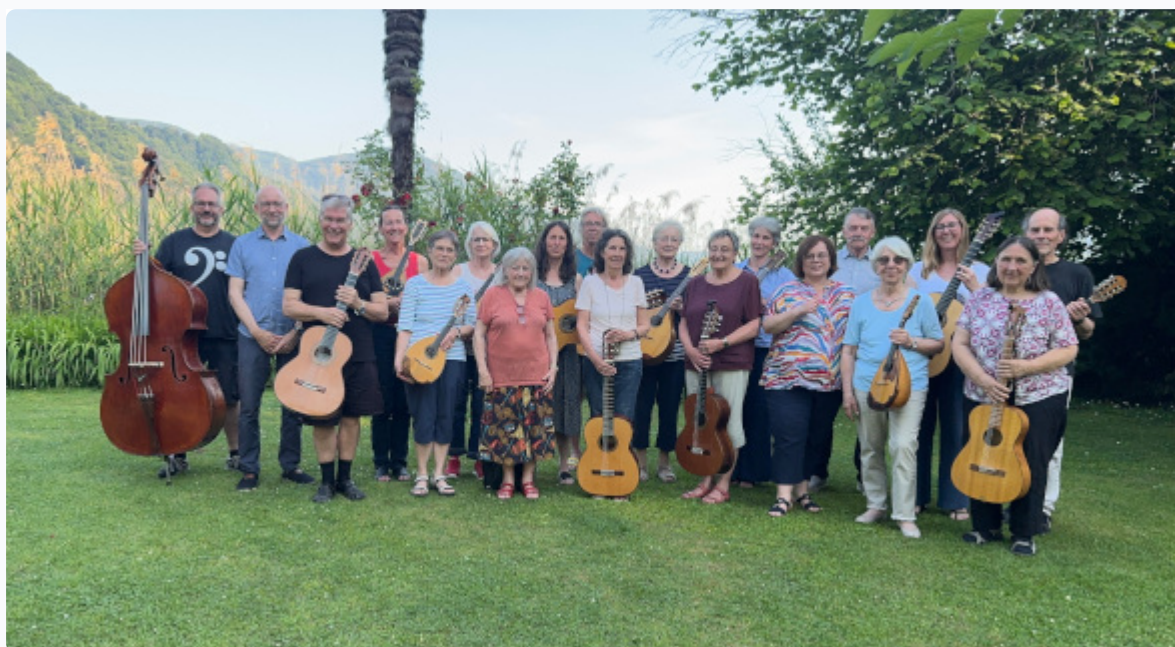
Teilnehmer ZVS-Kurs 2025 in Magliaso