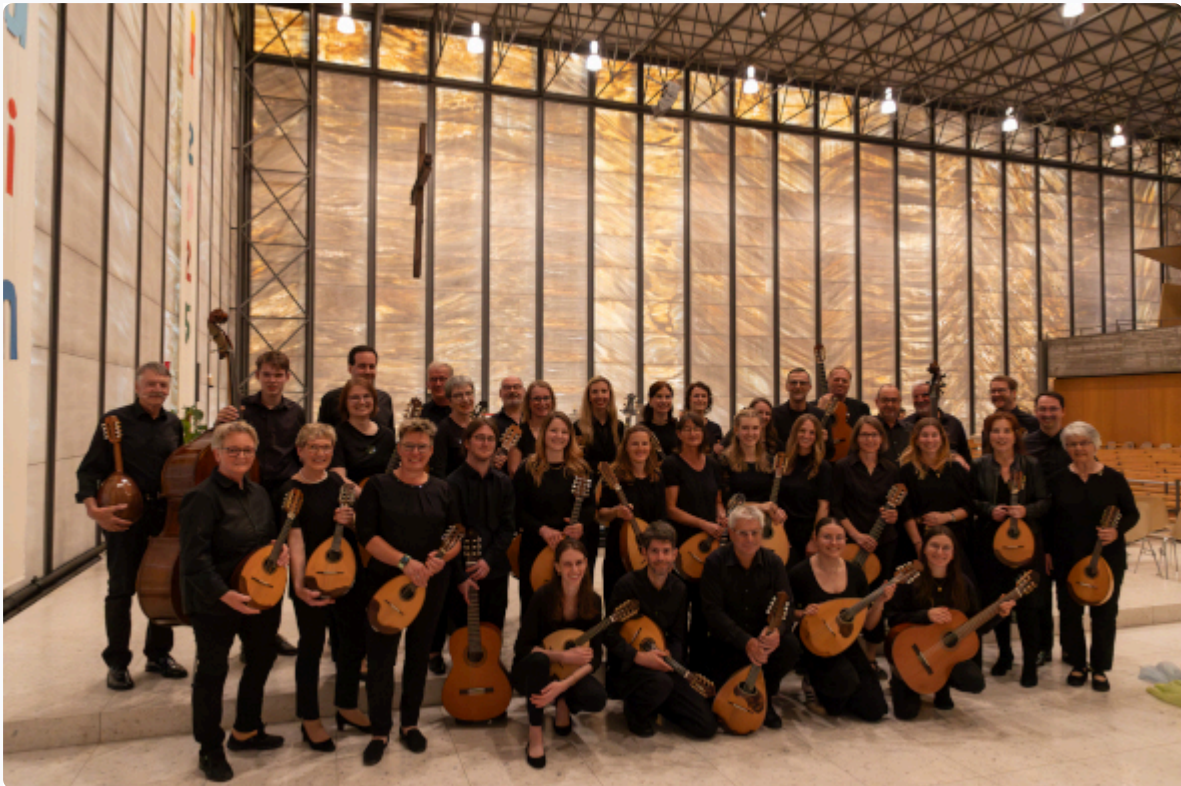
Zupforchester Luzern mit Zupforchester Ötzingen in der Kirche St. Pius in Meggen