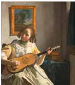
Die Gitarrenspielerin, 1672 Jan Vermeer van Delft (1632-1675)