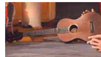
Biedermeier-Gitarre, 1825 Breslau