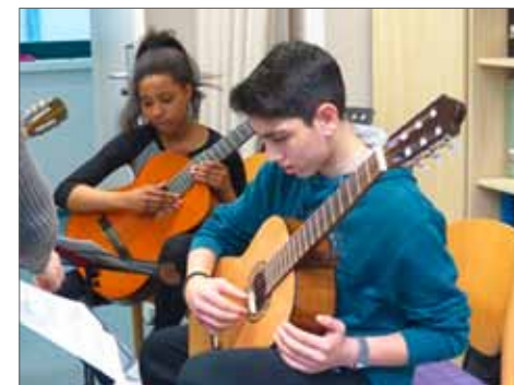
Nigeria und Irak

Instrumente ausgeliehen und Noten zur Verfügung gestellt.