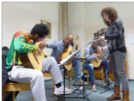
Aethiopien und Eritrea

linge kaum Probleme der Verständigung gibt. - Die ersten Stunden seien hart gewesen, jetzt werde es einfacher, meinen die jungen Männer. Die Gitarrenlehrerin ihrerseits zeigt sich zuversichtlich und sieht beide Schüler nach sechs Unterrichtseinheiten schon auf gutem Weg.